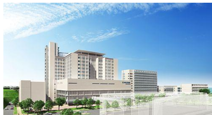
琉大病院の移設を筆頭に、返還を見据えたPJが目白押し！